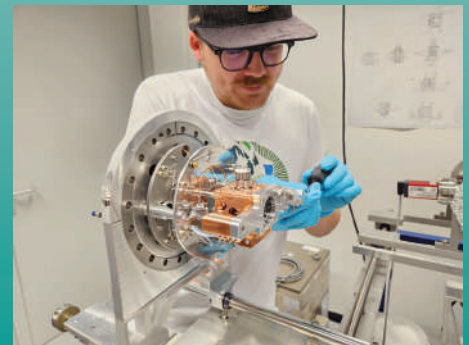
Montage- und Integrationsarbeiten