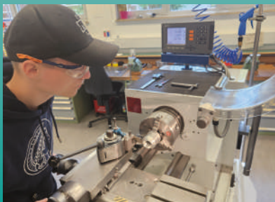
Fertigung an den konventionellen Maschinen

Der Ausbildungsplan enthält u.a. die Fertigung einer Dampfmaschine, eines Schraubstocks und eines Ferraris