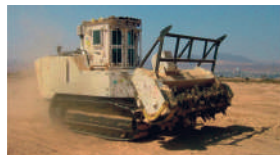
Unser Beitrag zum Weltfrieden: Wir bauen die Steuerkästen für diese Minenräumfahrzeuge, wel- che versteckte Minen zur Detona- tion bringen