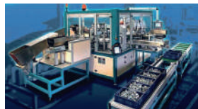
Eine von uns vor Ort beim Kun- den verkabelte und in Betrieb genommene Sortiermaschine