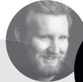
Daniel Technischer Modellbau