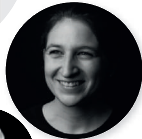
Julia CNC Frästechnik