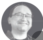
Daniel Oberflächen- technik

Don't be shy, get in touch. bewerbung@s-p-3.de